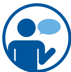
психолог учебного заведения